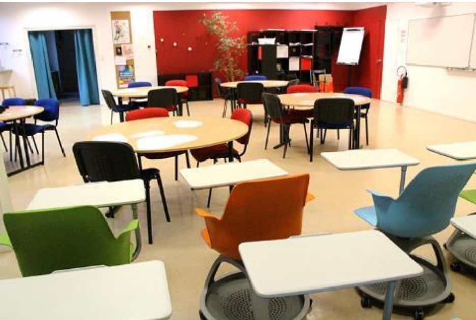
La Ruche Espace pédagogique d'ateliers créatifs