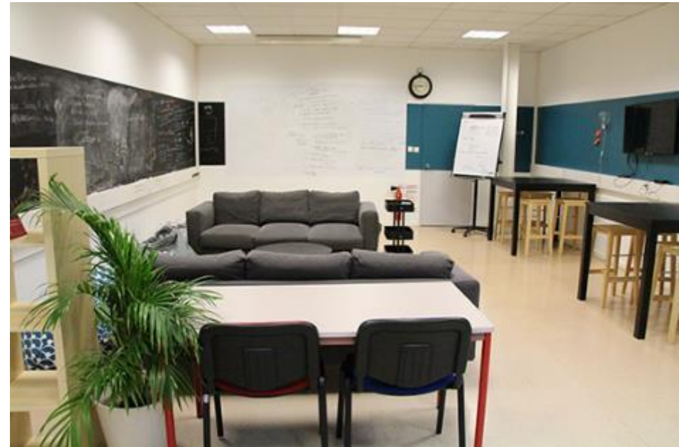
Le Hub Espace d'accueil et d rencontres informelles